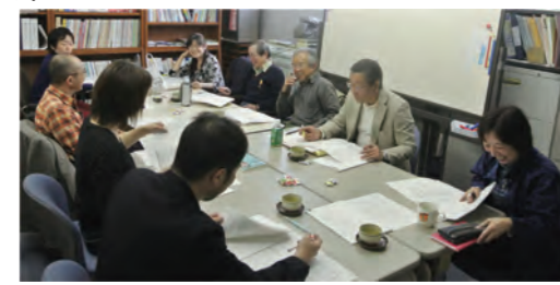
第1回運営委員会。記念の開催となる第10回の内容を検討

10年を超える年月を経た中でNPOと企業の協働の変化や到達点を明らかにし、今後の展望を熱く語る場になりそうです。